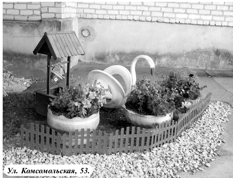
Ул. Комсомольская, 53.

Следующая улица – Зеленая. Дом № 13 привлекает внимание уголком для отдыха. Аккуратно, удобно, плетень и фонарик придают месту особый уют.