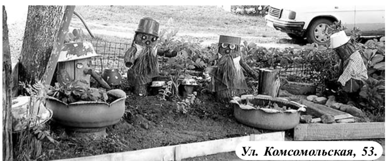
Ул. Комсомольская, 53.

ному. Нет на ней баллонов, вырезанных зверей и лебедей, но есть аккуратно окошенные газоны, высаженные на них декоративные деревья, вдоль заборов разбиты куртины из декоративных цветущих кустарников с добавлением многолетних цветов. Особо здесь хочу отметить территорию перед домом № 15.