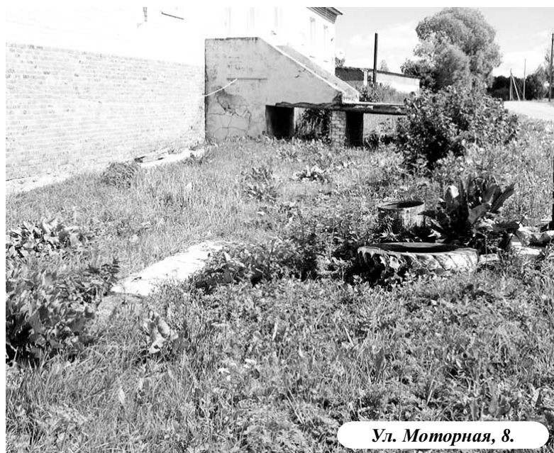
Ул. Моторная, 8.